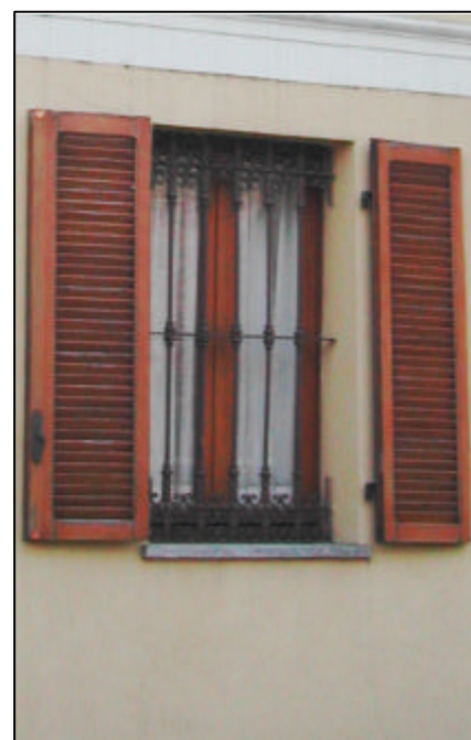
Finestra a due battenti con una specchiatura per anta; inferriata in ferro profilato a maglie rettilinee con decorazioni