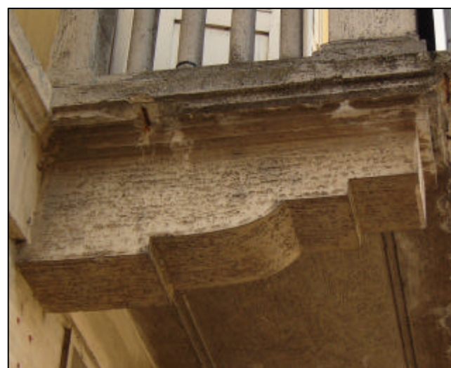
Modiglione in calcestruzzo sagomato e squadrato