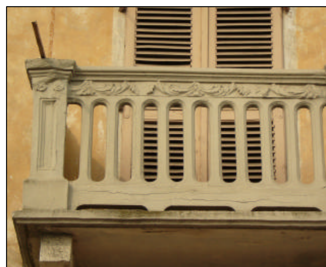
Balcone a ballatoio; soletta cementizia con modiglioni in pietra; ringhiera in elementi cementizi modellati a stampo