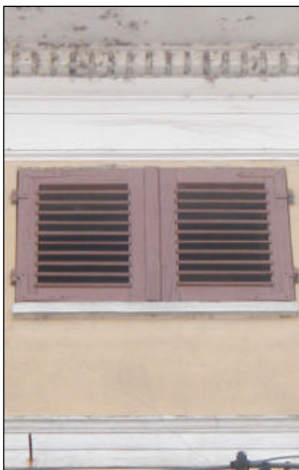
Persiana a stecche a due battenti; per finestra da sottotetto