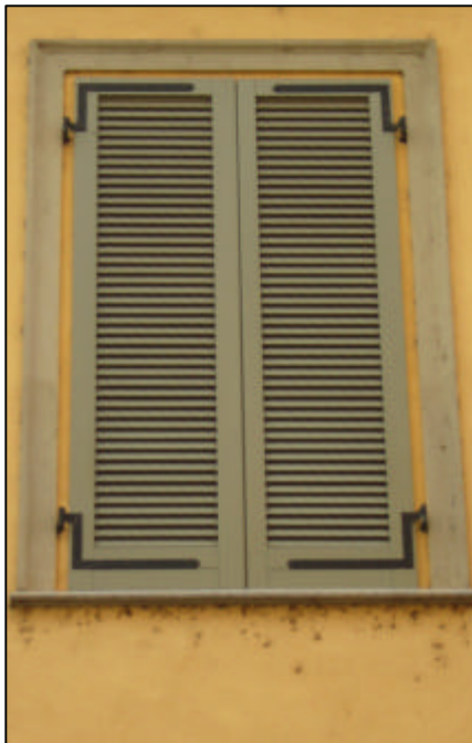
Persiana a stecche a due battenti con una specchiatura per anta; per finestra