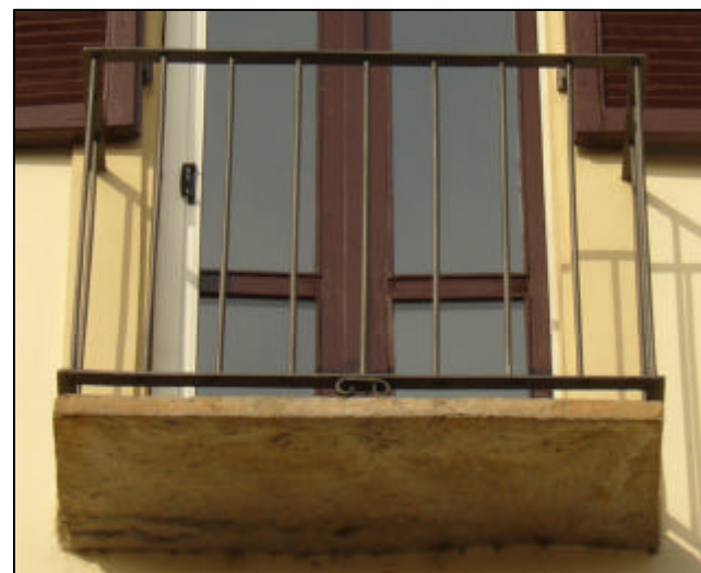
Lastra quadrangolare in pietra senza modiglioni; ringhiera in ferro profilato a disposizione lineare