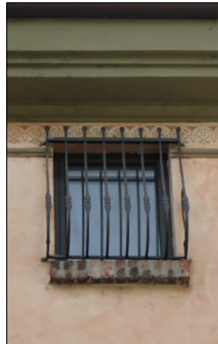
Finestra da sottotetto ad un battente con inferriata aggettante bombata