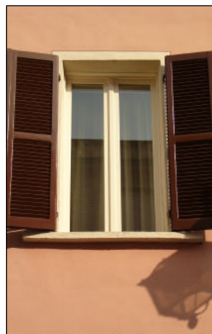
Finestra a due battenti con una specchiatura per anta