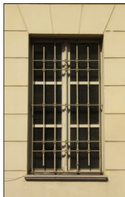
Finestra a due battenti con tre specchiature per anta; pannello cieco nella parte inferiore e sopra il lucio; inferriata in ghisa posizionata in spessore alla muratura