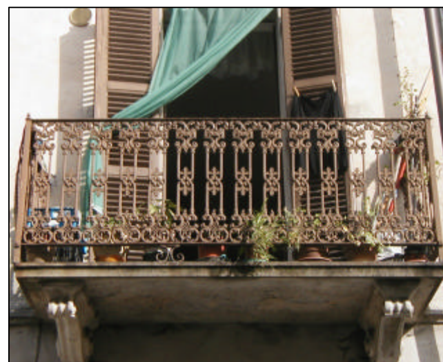
Lastra quadrangolare in pietra con modiglioni in calcestruzzo; ringhiera in ghisa