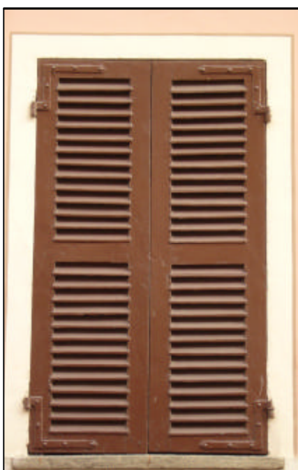
Persiana a stecche a due battenti con doppia specchiatura per anta; per finestra