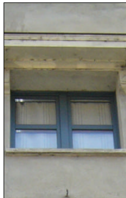
Finestra da sottotetto a due battenti con due specchiature per anta