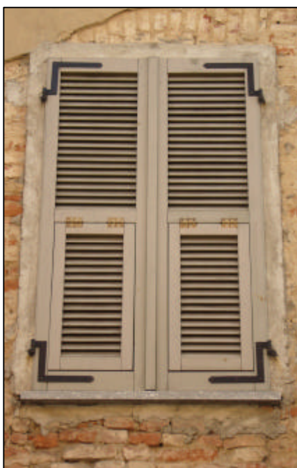
Persiana a stecche a due battenti con sportello a sporgere nella parte inferiore; per finestra