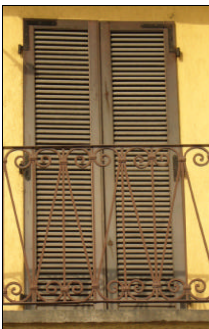
Persiana a stecche a due battenti con una specchiatura per anta; per portafinestra