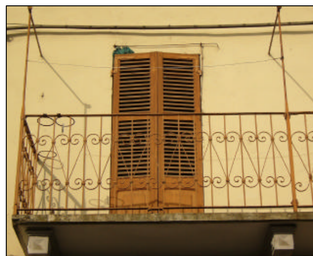
Balcone a ballatoio; soletta cementizia con modiglioni in calcestruzzo; ringhiera in ferro profilato con ornamenti curvilinei