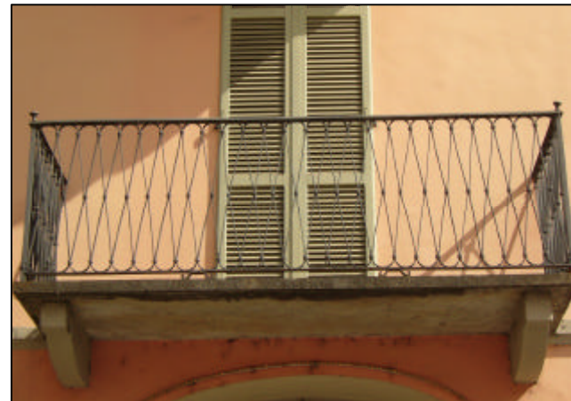
Lastra quadrangolare in pietra con modiglioni in pietra; ringhiera in ferro profilato a disposizione inclinata e curvata