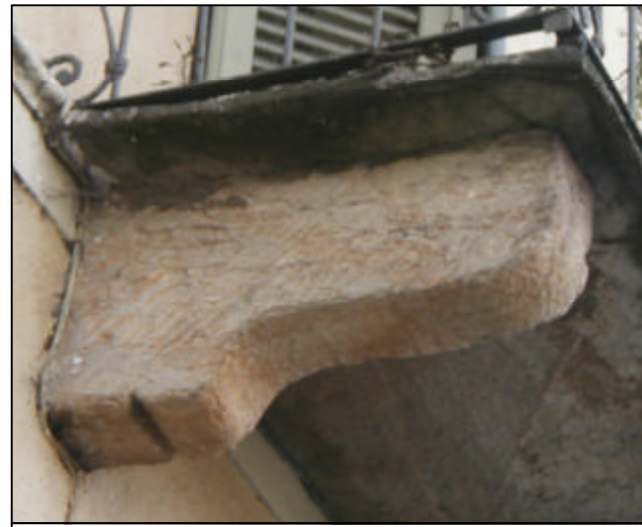
Modiglione in pietra sagomata a spigoli arrotondati