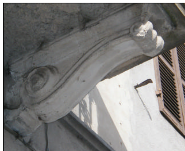
Modiglione in calcestruzzo sagomato con volute