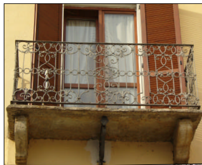
Lastra quadrangolare in pietra con modiglioni in pietra; ringhiera in ferro forgiato e battuto