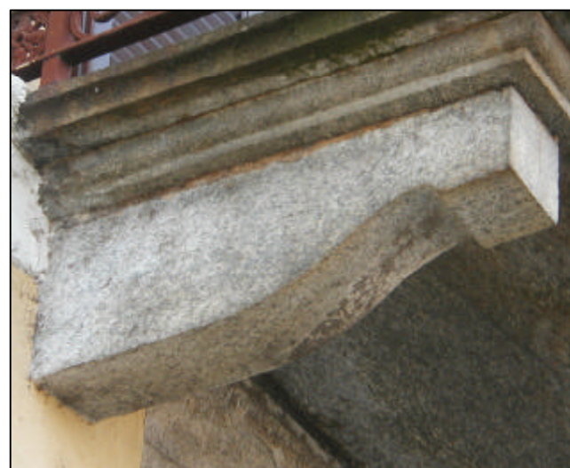
Modiglione in pietra sagomata e squadrata