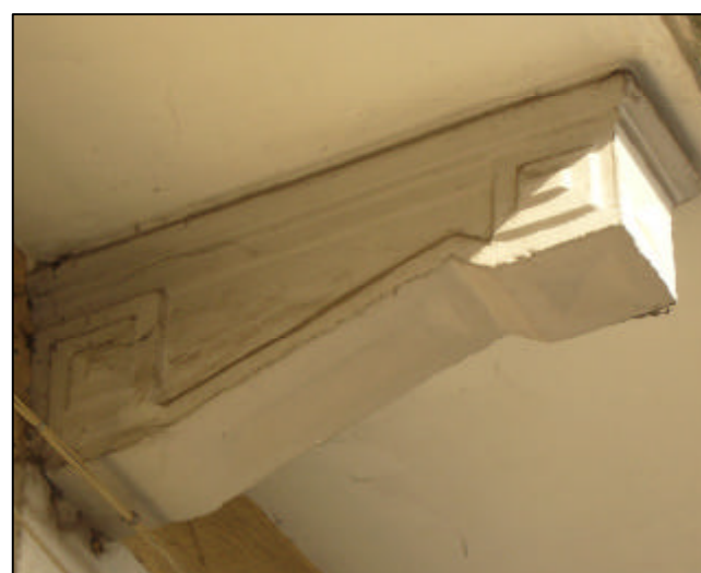
Modiglione in calcestruzzo sagomato e squadrato con modanature