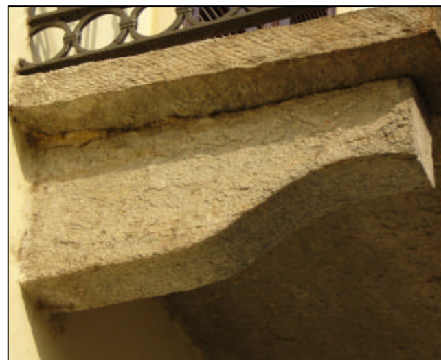
Modiglione in pietra sagomata a disegno semplice