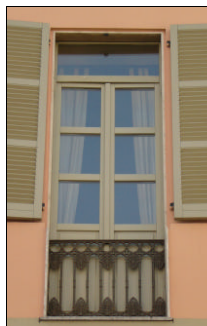
Portafinestra a due battenti con tre specchiature per anta; pannello cieco nella parte inferiore e sopra il lucio; ringhiera in ghisa posizionata in spessore alla muratura