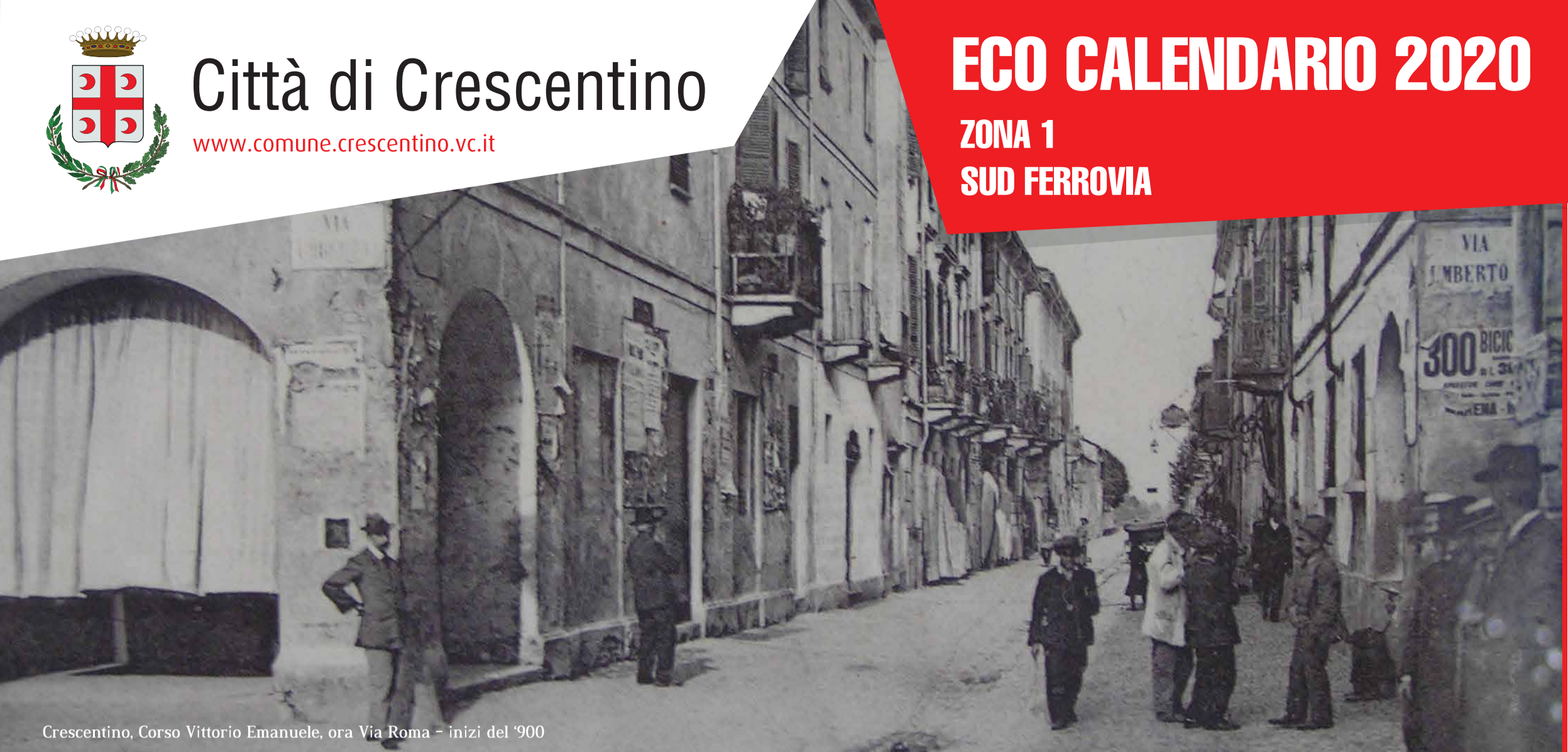
Crescentino, Corso Vittorio Emanuele, ora Via Roma - inizi del '900