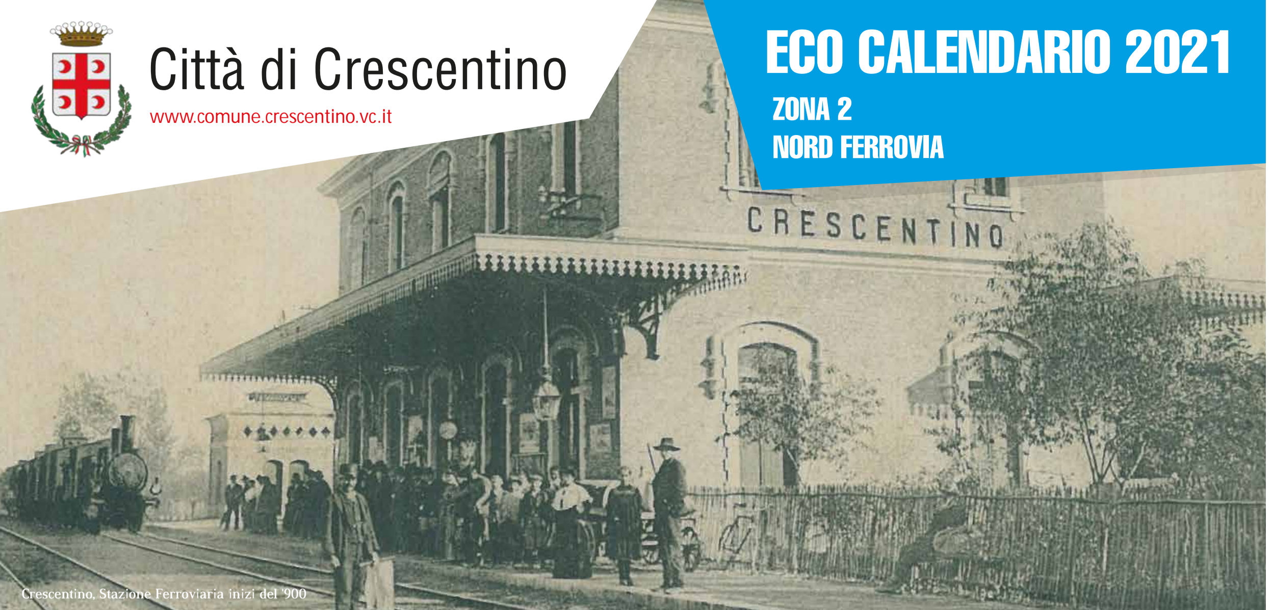
Crescentino, Stazione Ferroviaria inizi del '900