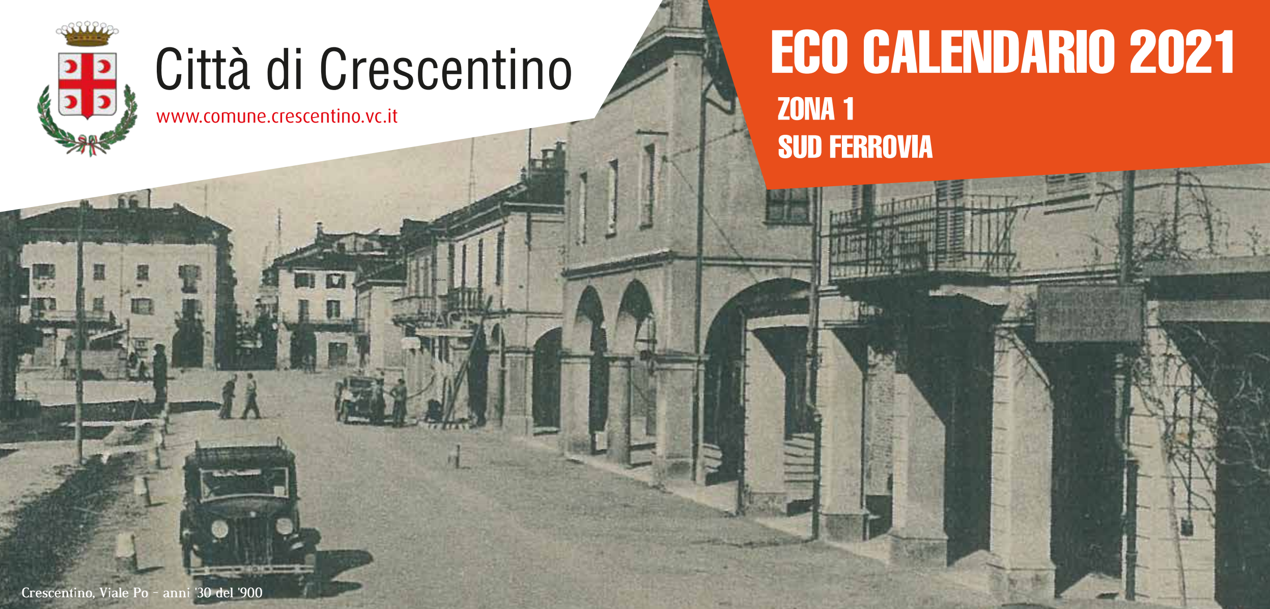
Crescentino, Viale Po - anni '30 del '900