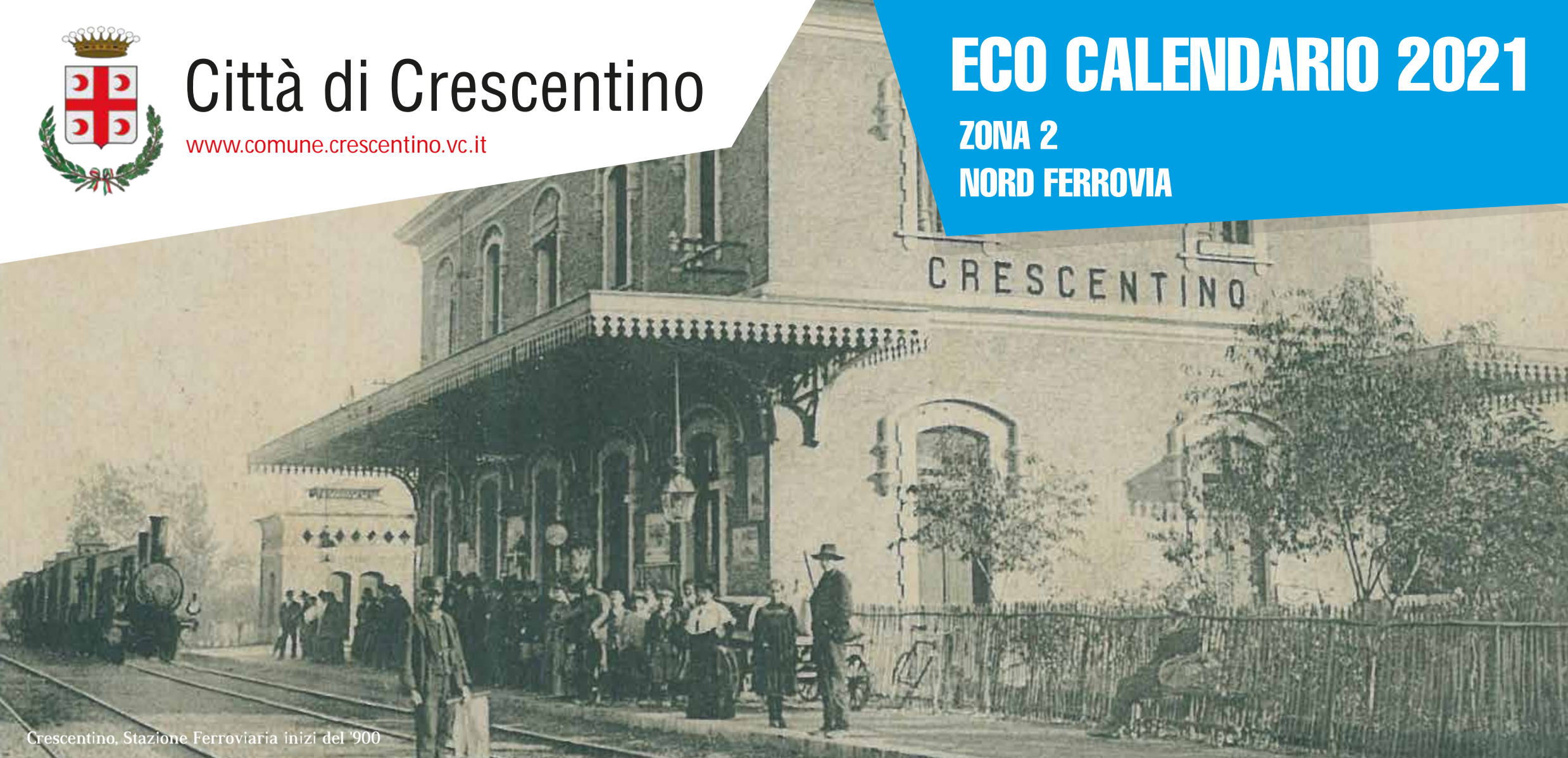
Crescentino, Stazione Ferroviaria inizi del '900